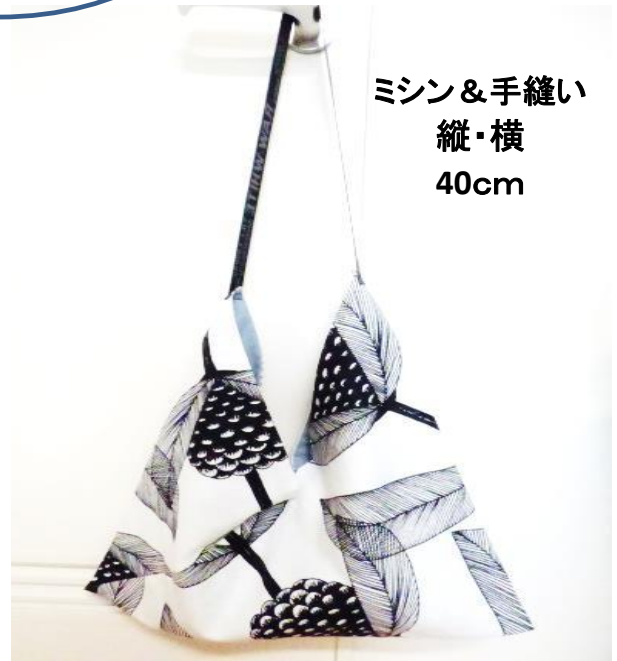
ミシン&手縫い 縦・横 40cm